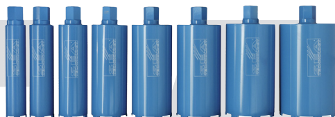
Set di 8 Foretti Corona Due 300